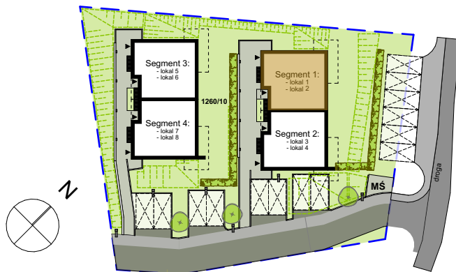
APARTAMENTY WISŁA - inwestycja i wypoczynek Segment 1, Lokal nr 1